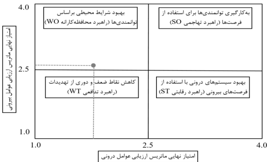
شکل ۳- تعیین راهبردهای مقابله با مخاطرات سیل در دشت همدان - بهار در ماتریس SWOT Figure 3. Determination of strategies to Confrontation flood hazards in Hamedan-Bahar plain in SWOT Matrix

شاید از دلایل عدم کارایی قوانین فعلی، می‌توان به خلاء موجود در قوانین، کمبود نیروی متخصص در ادارات مربوطه، تغییر کاربری اراضی و هم‌چنین عدم تخصیص بودجه کافی جهت حفظ و حراست از حریم و بستر رودخانه‌ها اشاره کرد. کمبودها و خلأهای فوق موجب کاهش قابلیت اجرای قوانین