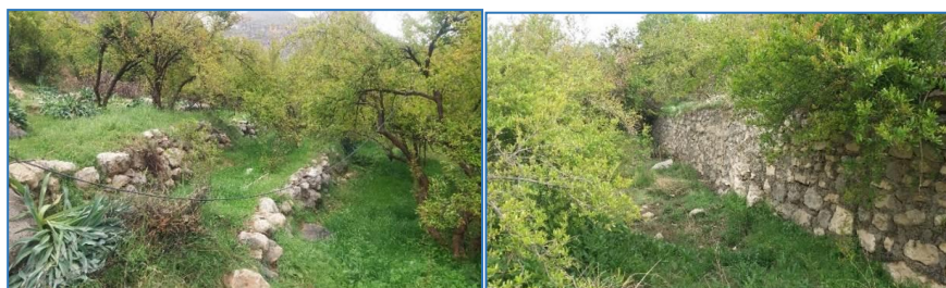
شکل ۲- نمایی از باغات سکوبندی شده در سایت تنگ بوان از سرشاخه های حوزه شهری شهرستان ممسنی Figure 2. A view of the terraced gardens in the Tang Boan site from the headwaters of the Mamsani basin

مشخصات حوزه آبخیز کل شیخی (سایت اول و دوم) کاربری اراضی کشاورزی و باغات انگور و بافت خاک عمدتاً لومرسی است و از نظر زمین شناسی رسوبات ابرفتی تراس های جوان و متوسط ارتفاع ۱۹۷۷ متر از سطح دریاهای آزاد با شیب متوسط وزنی 14/38 درصد و جهت شیب غالب جنوب شرقی است (شکل ۱). اقلیم حوزه سرد و مرطوب با متوسط بارندگی ۸۵۰ میلی متر در سال متوسط دما ۱۶ درجه سانتی گراد از نقطه نظر پوشش گیاهی در باغات درختان انگور با پوشش یک ساله و در اراضی که به صورت جنگل و مرتع مانده اند و دست نخورده اند پوشش اشکوب بالا درختان بلوط و زیر اشکوب پایین گون و گونه های یک ساله هستند.