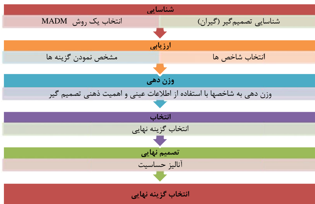
شکل ۳- فرآیند تصمیم‌گیری چندشاخصه

تصمیم‌گیری چندشاخصه روش‌های متعدد و متنوعی دارد اما از مهمترین الگوریتم‌های