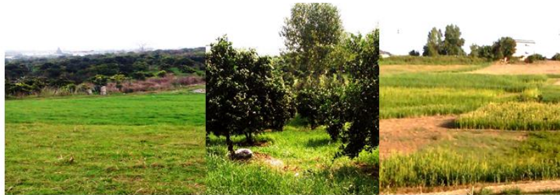
شکل ۲- نوع کاربری‌های مورد مطالعه (از چپ به راست: مرتع، باغ، زراعی) Figure 2. Pictures showing examples of the three land uses. From left to right: rangeland, orchard and agricultural

آزمایشگاه منتقل گردید و پس از هواخشک شدن و کوبیدن، از الک ۲ میلی‌متری عبور داده شدند. بافت خاک به روش هیدرومتر (۱۰)، جرم مخصوص ظاهری خاک به روش سیلندر (۴)، جرم مخصوص حقیقی به روش پیکنومتر (۵)، تخلخل خاک به صورت محاسباتی با استفاده از جرم مخصوص ظاهری و حقیقی طبق فرمول زیر اندازه‌گیری شد (۱۶).