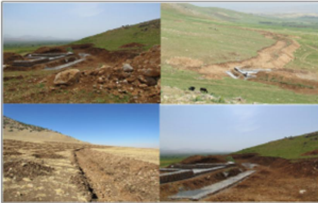
شکل ۳- جابجایی حجم زیاد خاک با بولدوزر حوضه رزین برای ایجاد کانال کنترل سیل. بر اساس مشاهدات میدانی، آثار فرسایش، لغزش، انحلال، رسوبگذاری و سیل در بالادست وجود نداشت و ژئومورفولوژی، پوشش گیاهی و خاکشناسی شرایط لازم برای نفوذ جریانات سطحی فراهم آورده است.