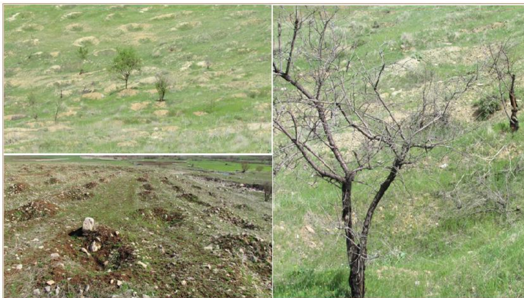
شکل ۲- باغات دیم و وضع موجود چاله‌ها و پایه‌های خشکیده Figure 2. Rain-fed orchards; pits and dried seedlings

اوج، تاخیر در سیل، زمان پایه سیل و حجم سیلاب ایجاد نکرد.