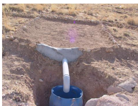
شکل ۴- تیمار جمع‌آوری پوشش گیاهی و سنگریزه سطح سامانه (زمین تمیز شده) Figure 4. Vegetation and gravel collection treatment (removed surface)

آماربرداری از میزان بارندگی و رواناب حاصل از آن در طی دو سال آبی متوالی (۹۳-۹۴ الی ۹۴-۹۵) انجام شد. اطلاعات مورد نیاز برای تجزیه و تحلیل بارش‌ها از باران‌سنج