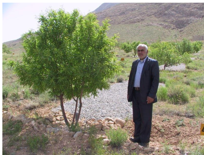
شکل ۵- رشد و نمو درختان بادام دیم تحت شرایط تیمار پلاستیک و سنگریزه (۲۴)

به منظور مدل نمودن میزان عمق رواناب استحصالی از سطوح آبیگر با تیمارهای به کار برده شده در شرایط اقلیمی نیمه‌خشک، میانگین ضریب رواناب در تیمارهای مختلف محاسبه شد. ضریب رواناب یکی از معیارهایی است که ویژگی نفوذپذیری یک سطح را در مقابل بارندگی نشان می‌دهد. نتایج پژوهش حاضر نشان داد که میانگین ضریب رواناب در تیمارهای شاهد (زمین دست نخورده) و جمع‌آوری پوشش سطحی در طی بارش‌های مورد بررسی، به ترتیب 1/8 و 7/7 درصد محاسبه شده است. این امر حکایت از آن دارد که پوشش گیاهی و خار و خاشاک موجود در سطح سامانه آبیگر دارای نقش قابل توجه در کاهش ضریب رواناب داشته و تنها حذف آن از سطح سامانه، ضریب رواناب را ۴ برابر افزایش داده است. این مزیتی است که تیمار جمع‌آوری پوشش سطحی به دلیل تمیز کردن همه ساله سطح پلات از گیاهان و افزایش ضریب رواناب نسبت به تیمار طبیعی به دست آورده است. تحقیقات هادی‌قورقی و اوسطی (۱۱) نیز در ارتباط با