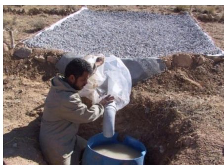
شکل ۳- اندازه‌گیری مقدار رواناب در مخزن جمع‌آوری رواناب در تیمار عایق Figure 3. Measurement of runoff amount in runoff collection reservoir in insulating treatment

برای ساخت سامانه عایق، ابتدا پوشش گیاهی سطح سامانه حذف شد و با استفاده از نایلون ضخیم و یک لایه ۵ سانتیمتری از سنگریزه بادامی بر روی آن، بستر سامانه عایق گردید. لبه نایلون بر روی پشته‌های خاکی خوابانیده شد تا رسوبی از بیرون وارد سیستم نشود و تمامی رواناب ایجاد شده در داخل سامانه، به پایین دامنه منتقل گردد. قسمت انتهایی سامانه طوری طراحی شد که همه رواناب به یک نقطه