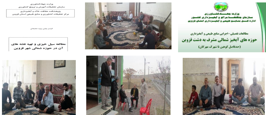
شکل ۳- تصاویری از جلسات، مطالعات موجود و بازدید از حوزه آبخیز جهت شناسایی مشکلات و تهیه پرسش‌نامه Figure 3. Pictures of meetings, existing studies and visits to the watershed to identify problems and prepare a questionnaire

K تعداد ستون‌ها یا سؤال‌ها، N تعداد سطرها، R_j حاصل جمع رتبه‌ها در ستون j ام است. در این حالت، درجه‌ی آزادی به‌روش k-1 است.