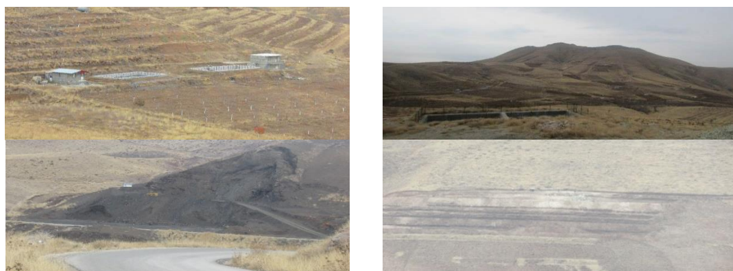
شکل ۴- تصاویری از مرحله شناسایی و اولویت‌بندی آسیب‌های حوزه آبخیز Figure 4. Images of the stages of identification and prioritization of watershed damage

K گویه‌ها، S_i^2 پراش امتیازهای کویه‌ی شماره i ام و S^2 پراش جمع امتیازهای هر پاسخگو (پراش کل گویه‌ها) است.