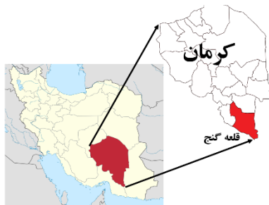
شکل ۲- موقعیت مکانی روستاهای مورد مطالعه Figure 2. Location of case study area

اجتماعی، همکاری نهادی، و پایداری زیستی که برای هر کدام از این مولفه‌ها، شش گویه (کلا ۳۰ گویه، به جزء سوالات مربوط به ویژگی‌های فردی) در نظر گرفته شدند. پرسشنامه‌های تکمیل شده، پس از بازبینی و بررسی دقت و صحت داده‌ها، مورد پردازش، تجزیه و تحلیل آماری قرار گرفتند. در بخش آمار توصیفی متغیرها، از آماره‌هایی همچون میانگین، میانه، مُد، انحراف معیار، بیشینه، و کمینه، و برای مقایسه میانگین‌های پارامترها از آزمون‌های همبستگی پیرسون، لوین، تی‌تست، رگرسیون، F، دوربین-واتسون و