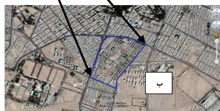
شکل ۱- موقعیت محدوده انتخابی در بافت قدیم (الف) و جدید (ب) شهر یزد Figure 1. Location of study area in old and new texture in Yazd city