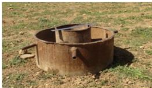
شکل ۲- استوانه‌های مضاعف نصب شده در محل تحقیق.

پس از تعیین محل‌های مناسب برای نمونه‌برداری، با استفاده از استوانه‌های مضاعف به دلیل معمول بودن شیوه و تامین اطلاعات مفید در صورت