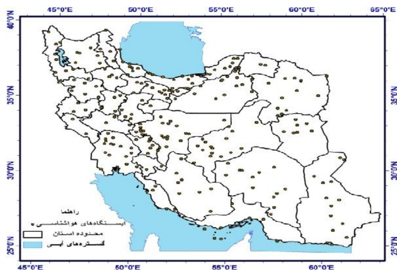
شکل ۱- شبکه ایستگاه‌های مطالعاتی

می‌کند. گاندو و ایسن (۶) نیز سه روش کریجینگ، کوکریجینگ و رگرسیون وزن‌دار جغرافیایی ۱ را برای پهنه‌بندی میانگین ۲۵ ساله بارش سالانه در ترکیه بررسی کردند. آنها با محاسبه ضریب همبستگی بین مقدار پیش‌بینی شده و الگو شده نتیجه گرفتند که روش رگرسیون وزن‌دار جغرافیایی با ضریب تبیین ۸۶٪ در مقایسه با روش کریجینگ و کوکریجینگ به ترتیب با ضرایب تبیین ۵۱٪ و ۶۷٪ درصد کمترین مقدار خطای پیش‌بینی را به خود اختصاص می‌دهد. قربانی (۵) روش‌های مختلف درون‌یابی قطعی و زمین‌آمار را با روش رگرسیون وزن‌دار جغرافیایی برای پهنه‌بندی و ترسیم نقشه هم‌بارش در استان گیلان مورد ارزیابی قرار داد و نتیجه گرفت روش رگرسیون وزن‌دار جغرافیایی در مقایسه با روش کریجینگ (در رتبه دوم کمترین خطا قرار داشت) به ترتیب با ریشه میانگین مربعات خطای برابر با ۱۴۷ و ۱۸۷ میلی‌متر با مقدار خطای کمتر می‌تواند در درون‌یابی و