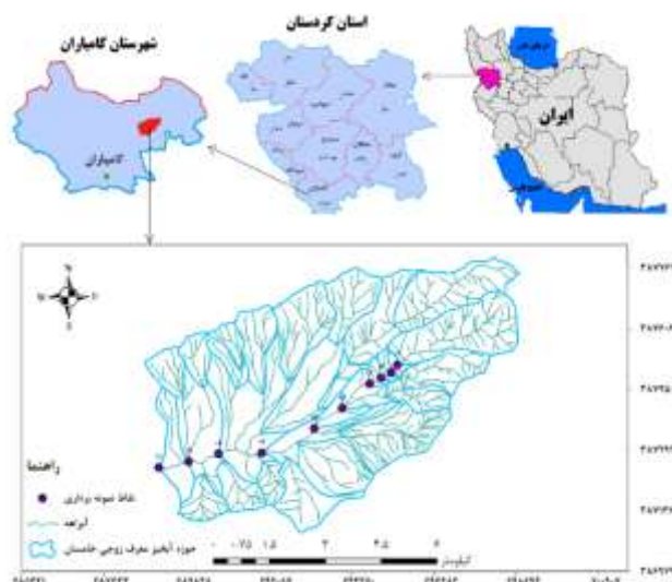
شکل ۱- موقعیت مکانی نقاط نمونه‌برداری از رسوب بستر در حوزه آبخیز خامسان Figure 1. Location of bed sediment sampling points in Khamsan watershed

حوزه آبخیز معرف زوجی خامسان با مساحت 4336/22 هکتار در 25 کیلومتری شمال شهرستان کامیاران در استان