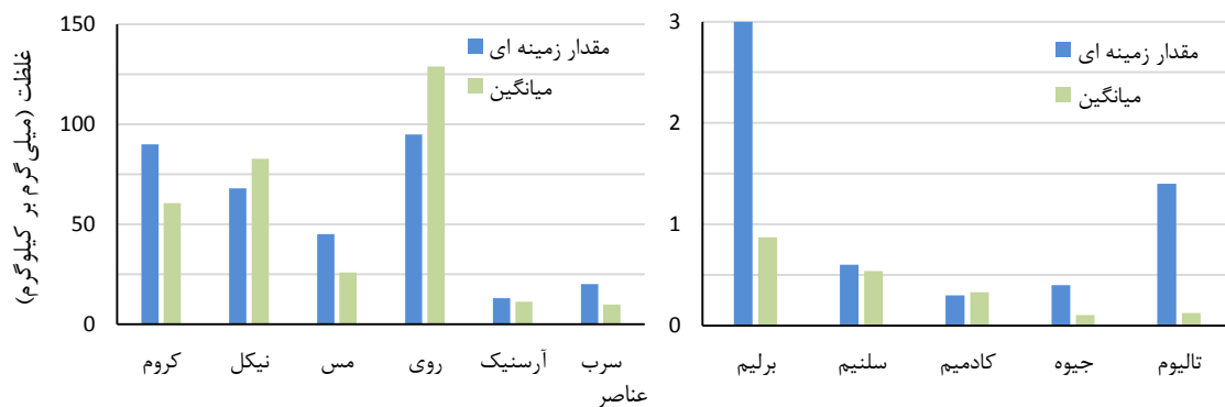
شکل ۳- میانگین غلظت اندازه گیری شده و غلظت زمینه ای فلزات سنگین (میلی گرم بر کیلوگرم) Figure 3. Average measured concentration and background concentration of heavy metals (mg/kg)