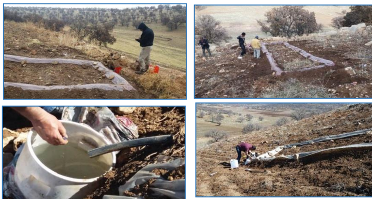
شکل ۳- پلات‌های احداث شده و مراحل اندازه‌گیری حجم رواناب در حوزه کل شیخی از سرشاخه‌های سد پارسیان در شهرستان ممسنی Figure 3. Constructed plots and the stages of measuring the runoff volume in the Sheikhi area of the main branches of the Parsian dam in Mamsani City

اراضی سکونندی و نه پلات در اراضی فاقد سکونندی) با ابعاد ۱۰ متر طول و ۲ متر عرض با مختصات دقیق احداث و رواناب پس از هر رویداد بارندگی اندازه‌گیری شدند. شکل (۳) پلات‌های احداث شده و مراحل اندازه‌گیری رواناب در حوزه کل شیخی از سرشاخه‌های سد پارسیان در شهرستان ممسنی را نشان می‌دهد.