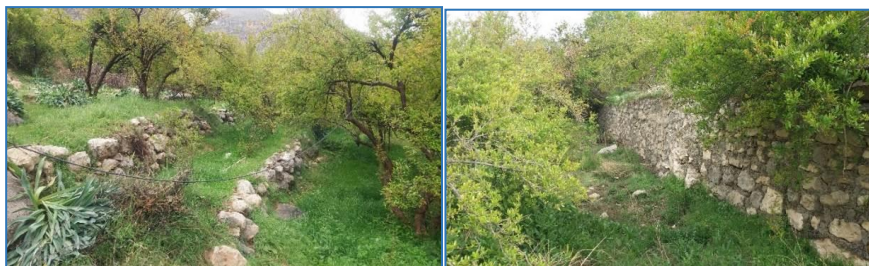
شکل ۲- نمایی از باغات سکوبندی شده در سایت تنگ بوان از سرشاخه های حوزه شهری شهرستان ممسنی Figure 2. A view of the terraced gardens in the Tang Boan site from the headwaters of the Mamsani basin

مشخصات حوزه آبخیز کل شیخی (سایت اول و دوم) کاربری اراضی کشاورزی و باغات انگور و بافت خاک عمدتاً لومرسی است و از نظر زمین شناسی رسوبات آبرفتی تراس های جوان و متوسط ارتفاع 1977 متر از سطح دریاهای آزاد با شیب متوسط وزنی 14/38 درصد و جهت شیب غالب جنوب شرقی است (شکل ۱). اقلیم حوزه سرد و مرطوب با متوسط بارندگی 850 میلی متر در سال متوسط دما 16 درجه سانتی گراد از نقطه نظر پوشش گیاهی در باغات درختان انگور با پوشش یک ساله و در اراضی که به صورت جنگل و مرتع مانده اند و دست نخورده اند پوشش اشکوب بالا درختان بلوط و زیر اشکوب پایین گون و گونه های یک ساله هستند.