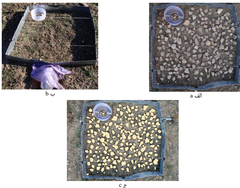
شکل ۲- الف) استقرار کرت ب) نصب ظرف نمونه‌برداری رواناب در خروجی کرت و ج) نمایی از تعیین پوشش سنگ و سنگ‌ریزه سطحی در محیط نرم‌افزار ArcGIS