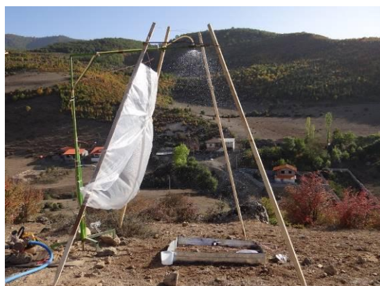
شکل ۳- نمایی از شبیه‌ساز باران مورد استفاده در شرایط صحرایی Figure 3. A view of rainfall simulator used in field condition

پس از شروع بارندگی شبیه‌سازی شده، زمانی که اولین قطره به خروجی کرت می‌رسد به‌عنوان زمان شروع رواناب، با استفاده از زمان سنج ثبت شد. سپس برای برداشت نمونه‌های رواناب دو مرتبه در هر دو دقیقه (۴ دقیقه اول)، دو مرتبه در هر سه دقیقه (۶ دقیقه بعدی) و سه مرتبه در هر پنج دقیقه (۱۵ دقیقه آخر) و در مجموع برابر با ۲۵ دقیقه پس از شروع رواناب به‌صورت جداگانه جمع‌آوری و اندازه‌گیری شدند. حجم